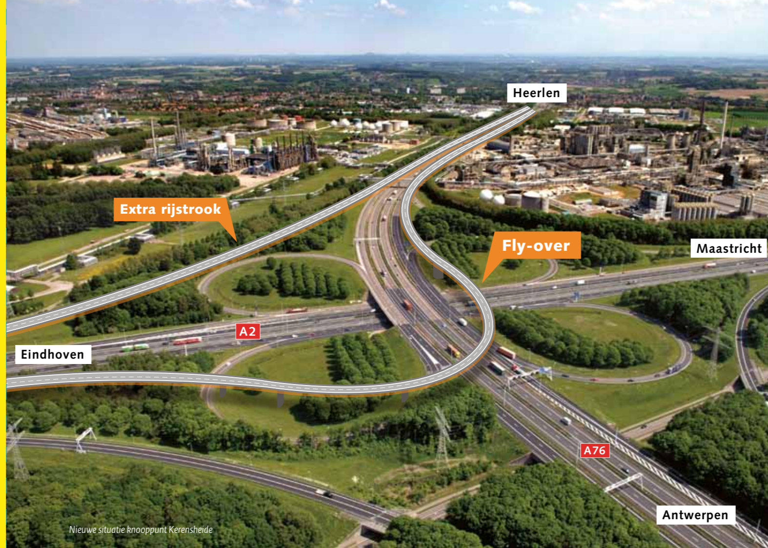
Nieuwe situatie knooppunt Kerensheide

Op het WAB A2 Maasbracht - Geleen en bijbehorende uitvoeringsbesluiten kan door belanghebbenden beroep worden ingesteld. De periode dat het WAB ter visie ligt, start op 15 december 2010 en loopt tot en met 25 januari 2011. Als u op het OWAB hebt gereageerd, kunt u binnen de zes weken dat het WAB ter visie ligt, beroep aantekenen bij de Afdeling bestuursrechtspraak van de Raad van State. Naast het WAB liggen ook de uitvoeringsbesluiten ter visie. Het WAB ligt vanaf 15 december 2010 zes weken ter visie op de volgende plekken: - de gemeentehuizen van Echt-Susteren, Sittard-Geleen en Stein; - het Provinciehuis van de provincie Limburg in Maastricht; - het Waterschap Roer en Overmaas in Sittard;