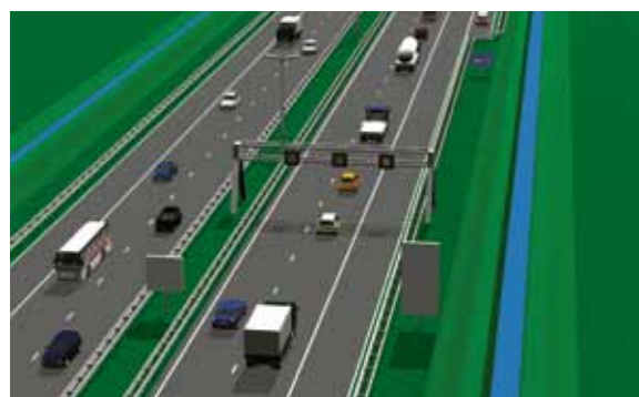
Gesloten spitsstrook met pechhaven

Een spitsstrook wordt alleen geopend als er meer dan drieduizend voertuigen per uur over de weg rijden en er een grote kans op file is. De verkeerscentrale signaleert wanneer het aantal van drieduizend voertuigen per uur bijna is bereikt, waarna de spitsstrook wordt opengesteld. Wanneer het aantal voertuigen minder is dan drieduizend per uur sluit de verkeerscentrale de spitsstrook.