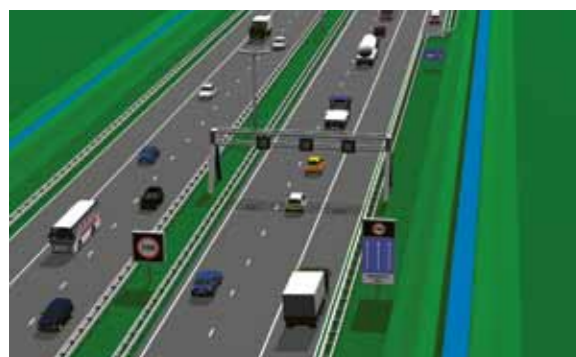
Open spitsstrook met pechhaven