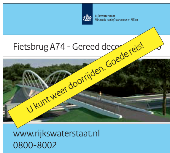
Bouwbord met toegevoegde plank 'werkzaamheden afgerond'

Het is mogelijk om een gele plank toe te voegen als de werkzaamheden zijn afgerond. De plank wordt diagonaal over het bouwbord geplaatst. De tekst staat in de RijksoverheidSans Heading Regular, gecentreerd, in zwart op een gele ondergrond.