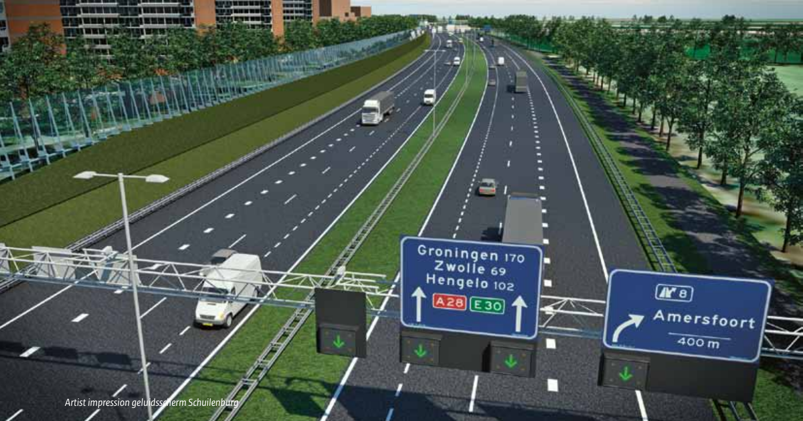
Artist impression geluidsscherm Schuilenburg