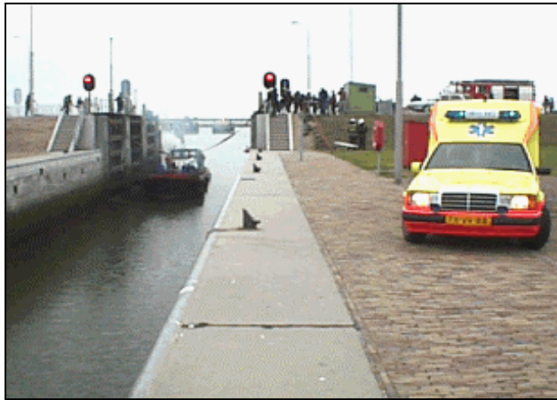
Figuur 1.7 Afvoer gewonden, na aanvaring, door Centrale Post Ambulancevervoer