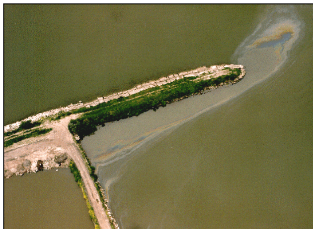
Figuur 1.1 Verontreiniging op een oever

Acute verontreinigingen kunnen ontstaan op het water of kunnen vanaf de oever in het water terechtkomen. Ook kunnen verontreinigingen vanaf het water aanspoelen op de oevers. Verontreinigingen kunnen het gevolg zijn van rampsituaties waarbij bijvoorbeeld ook mensenlevens kunnen worden bedreigd of grote economische belangen in het spel zijn.